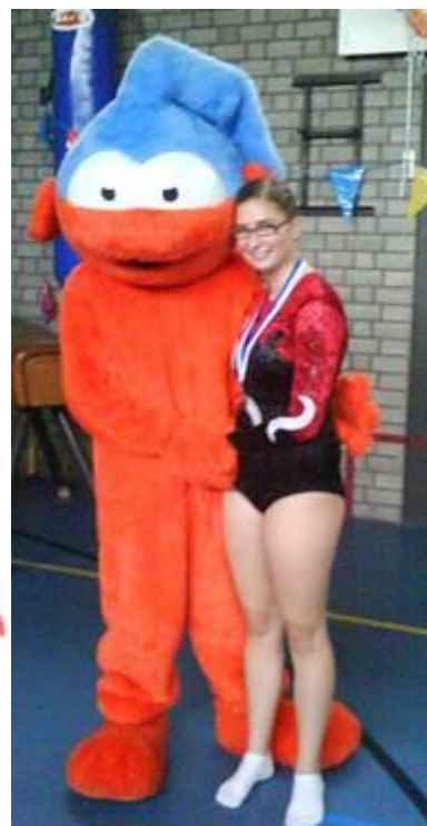
Met Gymmie, de KNGU mascotte.

Het leek mij erg leuk om naast het lid zijn en assisteren, nog iets extra's bij te dragen aan de vereniging. Al een hele tijd was het bestuur op zoek naar een nieuwe secretaris en toen ik bijna 18 was, heb ik gezegd, dat ik zodra ik oud genoeg was die taak op mij wilde gaan nemen. Dit betekende dat ik dinsdag bij de ALV (algemene leden vergadering) een heel pakket meekreeg waarin alle secretaris spullen zaten. Deze ga ik in de vakantie allemaal zorgvuldig doorlezen en bekijken en dan hoop ik dat ik mijn taak als secretaris goed zal volbrengen!